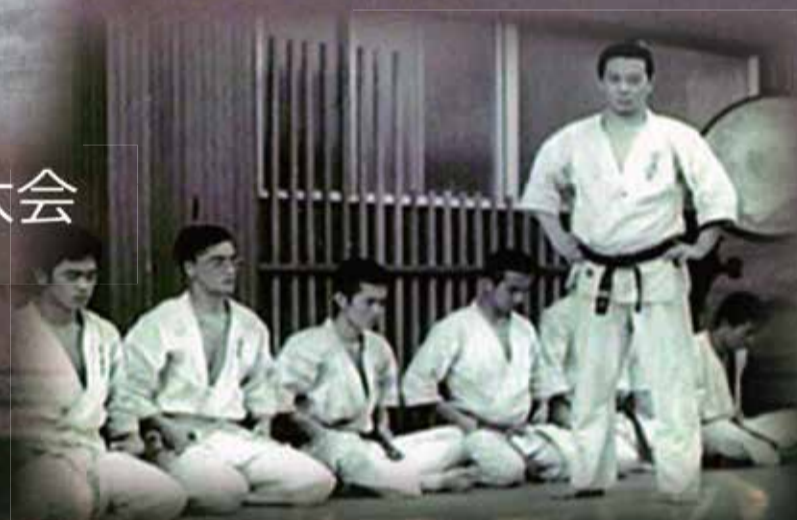
1973年 総本部指導員時代