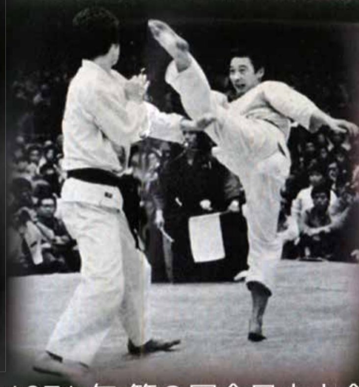
1971年 第3回全日本大会